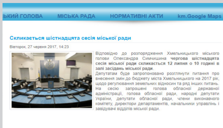
Скріншот з офіційного сайту Хмельницької міської ради

12 липня 2017 року заплановано проведення чергової 16-ої сесії Хмельницької міської ради, про що йдеться в анонсі на офіційному сайті. Сам анонс містить інформацію про те, що чергова сесія скликається розпорядженням Хмельницького міського голови, а також опис загальних рис порядку денного.