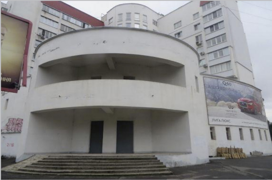
Фото приміщення, що реконструюється під музейний комплекс історії та культури

чатку. Враховуючи початкові темпи фінансування цього проекту – реконструкція може затягнутися не тільки на 5 років.