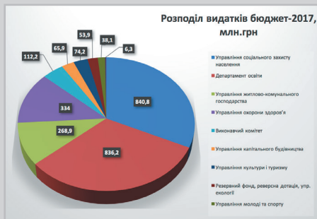
Аналіз видаткової частини бюджету м. Хмельницького на 2018 р. (млн.грн)

Якщо порівнювати показники видатків за напрямками у бюджетах на 2017 та 2018 рр., то виходять такі результати