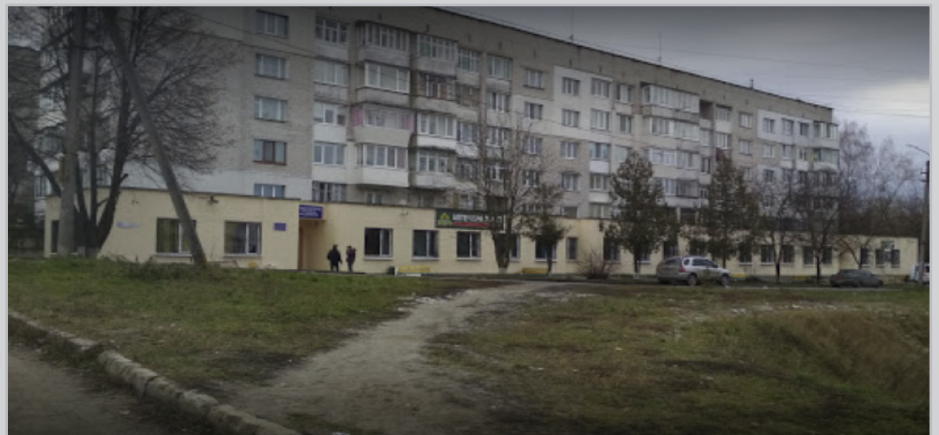
Хмельницький міський центр первинної медико-санітарної допомоги № 1

Також у бюджеті передбачено кошти для Хмельницької міської лікарні на капітальні ремонти відділень (1,7 млн. грн). Аналогічна і тут склалась ситуація, адже 16 грудня 2017 року міська лікарня оприлюднила звіт про укладений договір із копією цього договору капітального ремонту терапевтичного відділення № 1 ХМЛ (додаткові роботи) на загальну суму 188 830,00 грн, однак не було розміщено додаток № 1 до договору, який вміщує в себе календарний графік фінансування та виконання робіт. Виконавцем робіт визначено ФОП