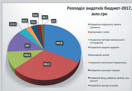
Аналіз видаткової частини бюджету м. Хмельницького на 2017 рік

Обсяг доходів бюджету м. Хмельницького на 2018 рік становить 2 млрд. 922 млн. 330 тис. 382,92 грн (у тому числі: загального фонду – 2 788 161 964,92 грн, спеціального фонду – 134 168 418,0 грн).