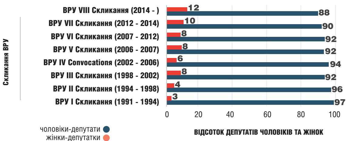
Рис. 2. Відсоткове співвідношення депутатів чоловіків та жінок у ВРУ різних скликань