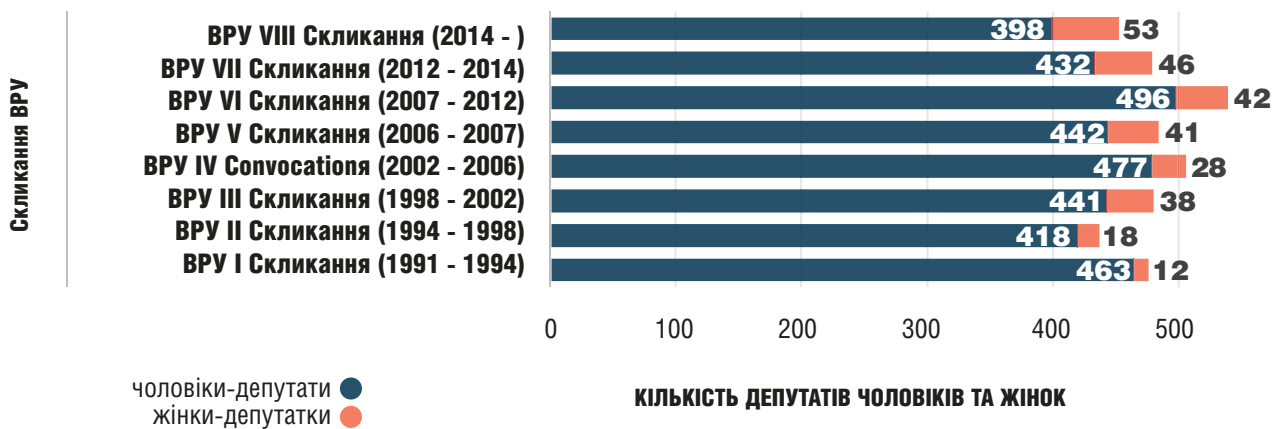
Рис. 1. Кількість депутатів чоловіків та жінок у Верховній Раді України різних скликань

Методологія розрахунку: протягом одного скликання Верховної Ради України загальна кількість депутатів може перевищувати загальну кількість мандатів. У зв'язку з цим, для найбільш точного порівняння представництва жінок у Верховній Раді України кожного скликання ми взяли загальну кількість депутатів та порівняли їх із загальною кількістю жінок-депутаток протягом усього періоду скликання.