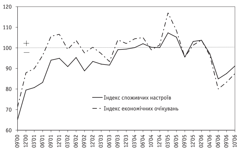
Графік 3. Індекс споживчих настроїв