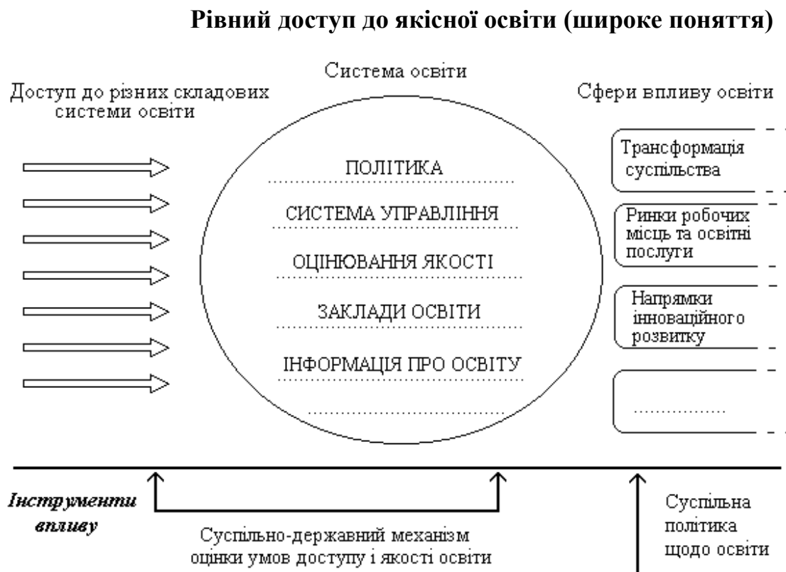
Схема 4.2. Рівний доступ до якісної освіти (широке поняття)